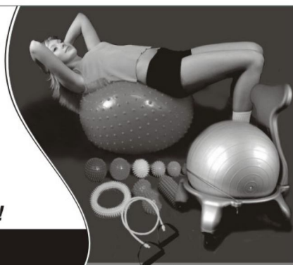
Массажные и гимнастические изделия